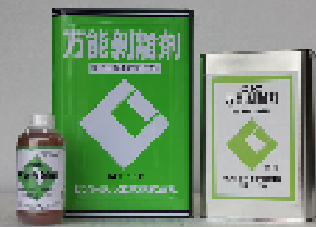
CIC万能剥離剤 18L・4.5L・500ml 金枠・木枠両用(原液使用)