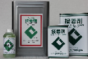
CIC接着剤(セメントノロタイプ) 18kg・4.5kg・1.8kg・500ml モルタル・コンクリート密着用