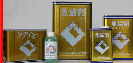
CIC急結剤 18kg・9kg・4.5kg・1.8kg・500ml セメントの急速硬化用