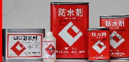
CIC防水剤 18kg・9kg・4.5kg・1.8kg・500ml モルタルの防水・防湿用