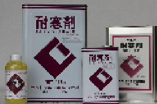
CIC耐寒剤(塩カルタイプ) 18kg・4.5kg・1.8kg・500ml 低温時のコンクリート・モルタルの凍結防止用、 セメントの硬化促進用