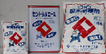
セントラルエース(無塩) 18kg CIC粉末耐寒剤(無塩) 9kg・1.2kg 低温時のコンクリート・モルタルの凍結防止用、 セメントの硬化促進用