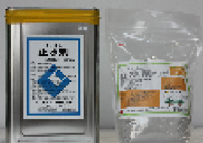
CIC止水剤 20kg・4kg 接着性瞬結止水セメント